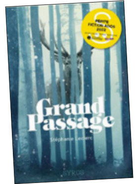
❑ GRAND PASSAGE Stéphanie Leclerc SYROS ☆☆☆☆☆