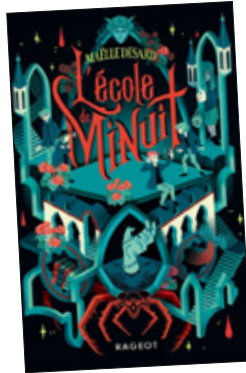
□ L'ÉCOLE DE MINUIT Maëlle Desard RAGEOT ☆☆☆☆☆