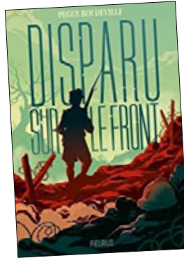
❑ DISPARU SUR LE FRONT Peggy Boudeville FLEURUS ☆☆☆☆☆