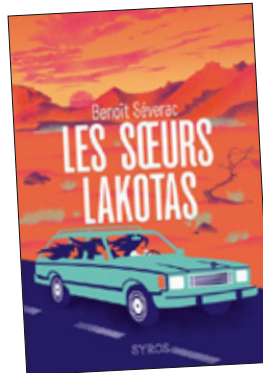
❑ LES SŒURS LAKOTAS Benoît Séverac SYROS ☆☆☆☆☆