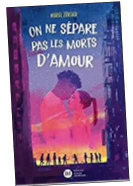
❑ ON NE SÉPARE PAS LES MORTS D'AMOUR Muriel Zürcher DIDIER JEUNESSE ☆☆☆☆☆