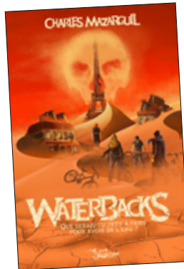
□ WATERBACKS Charles Mazarguil SLALOM ☆☆☆☆☆