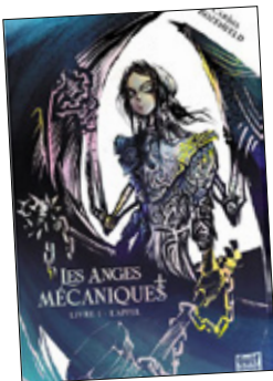
❑ LES ANGES MÉCANIQUES - LIVRE 1 Carina Rozenfeld GULF STREAM ☆☆☆☆☆